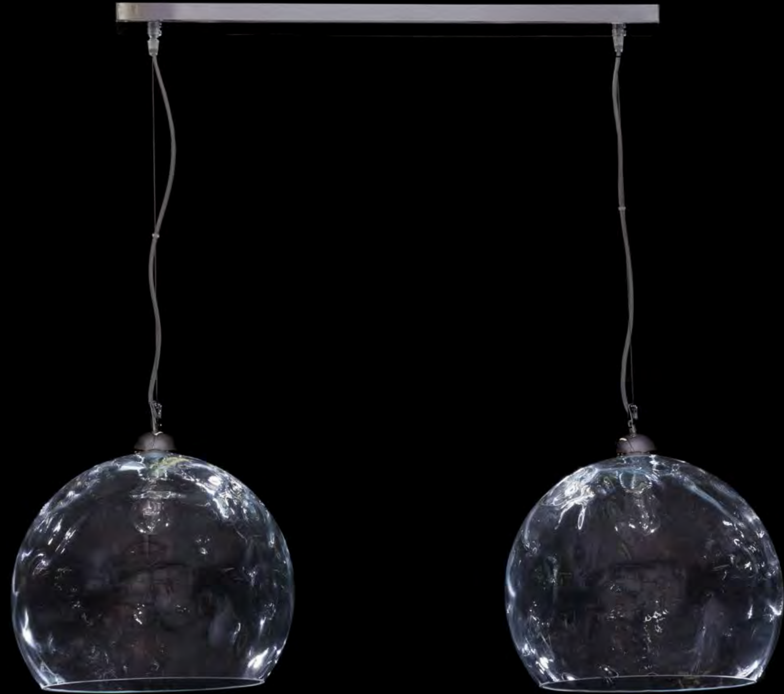
13/0236-2 L120 P35 H70/100