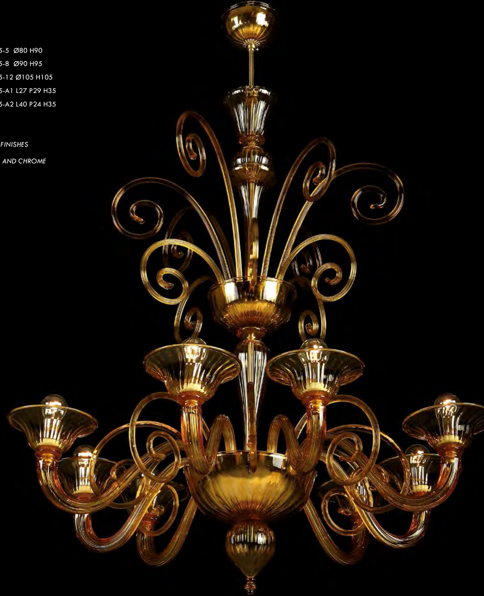
13/0215-6 Ø85 H90

AVAILABLE FINISHES AMBER CRYSTAL AND CHROME WHITE BLACK RED