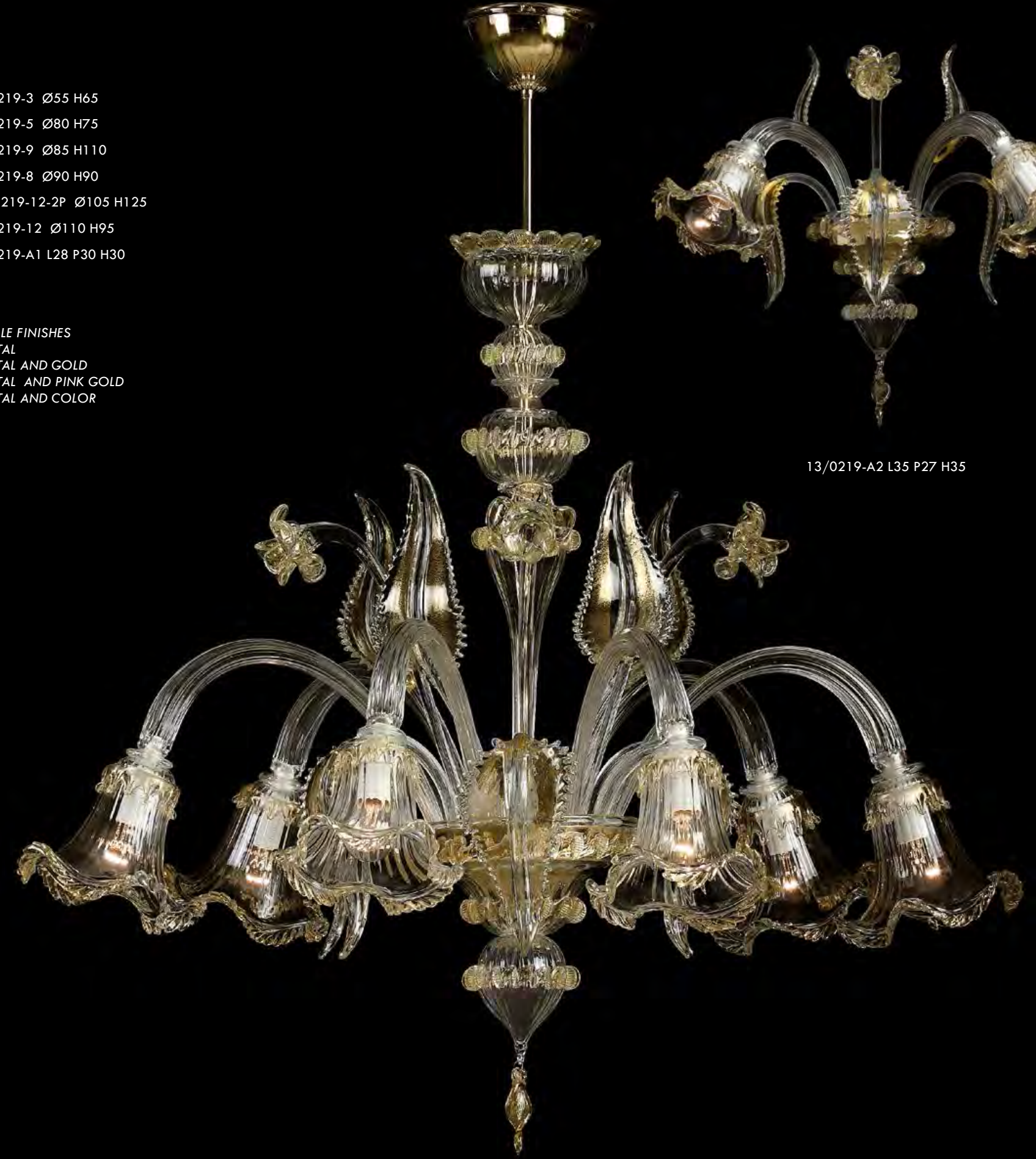
13/0219-6 Ø85 H75