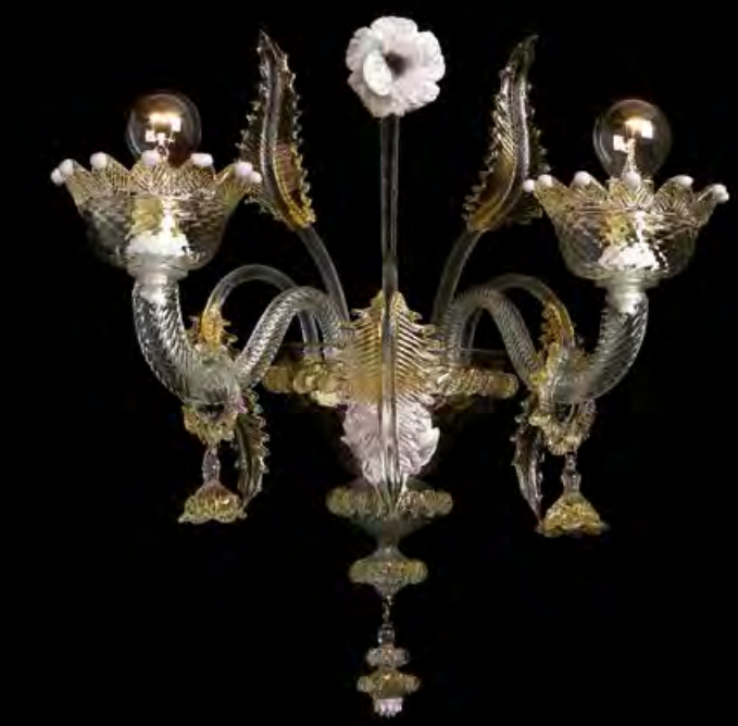
13/0231-A2 L40 P24 H35