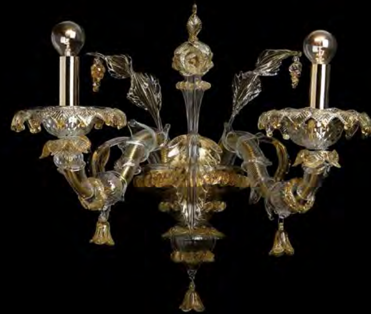
13/0233-A2 L40 P30 H45

13/0219-3 Ø55 H65 13/0219-5 Ø80 H75 13/0219-9 Ø85 H110 13/0219-8 Ø90 H90 13/0219-12-2P Ø105 H125 13/0219-12 Ø110 H95 13/0219-A1 L28 P30 H30