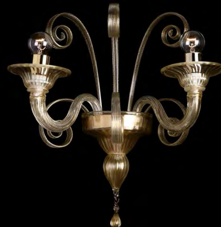
13/0217-A2 L35 P27 H35