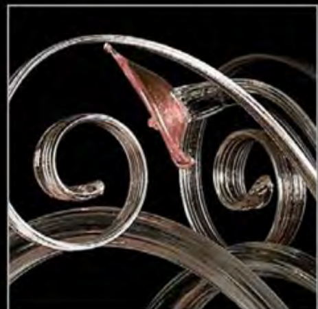
CRYSTAL AND COLOR (PINK)