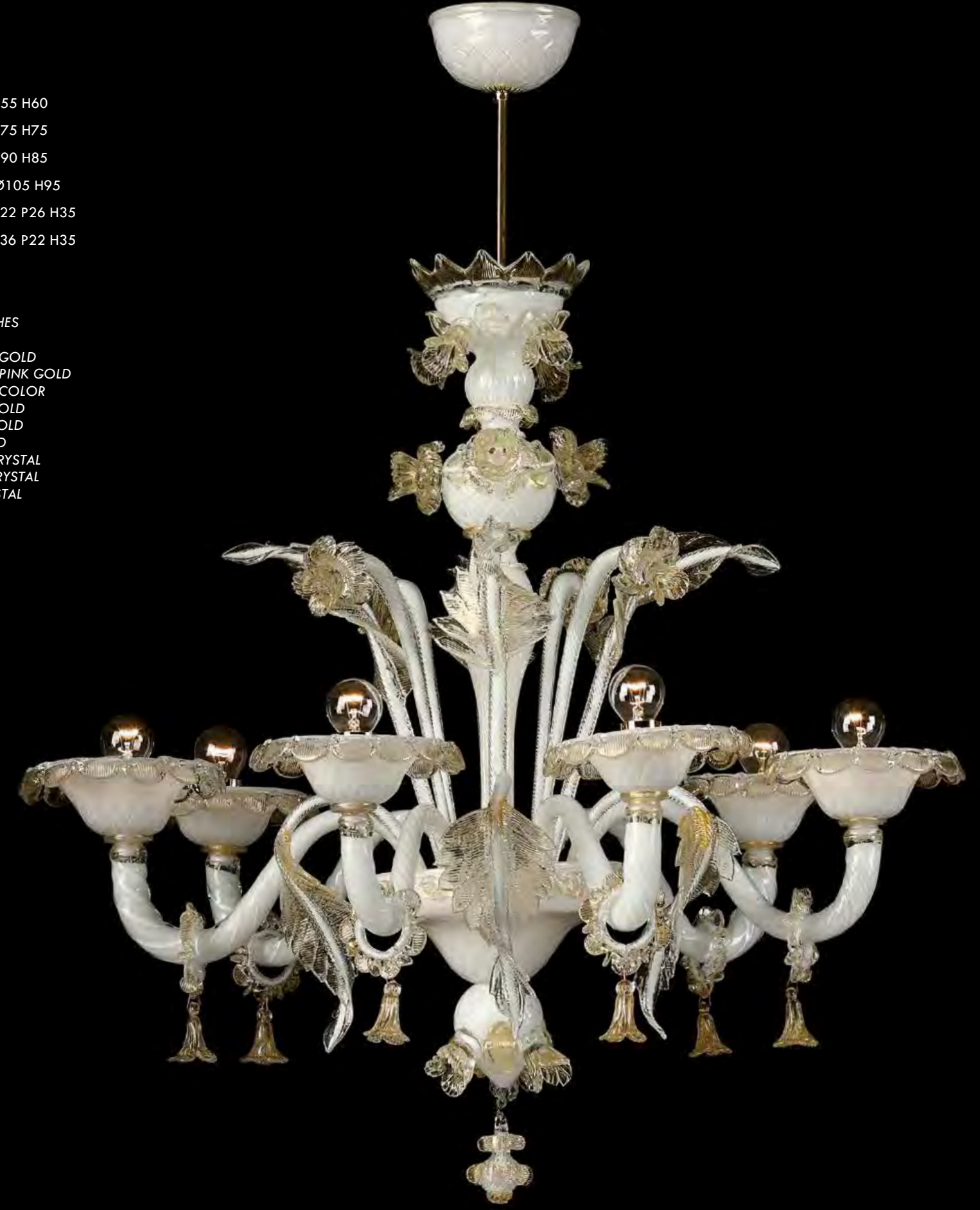
13/0229-6 Ø80 H75

AVAILABLE FINISHES CRYSTAL CRYSTAL AND GOLD CRYSTAL AND PINK GOLD CRYSTAL AND COLOR WHITE AND GOLD BLACK AND GOLD RED AND GOLD WHITE AND CRYSTAL BLACK AND CRYSTAL RED AND CRYSTAL