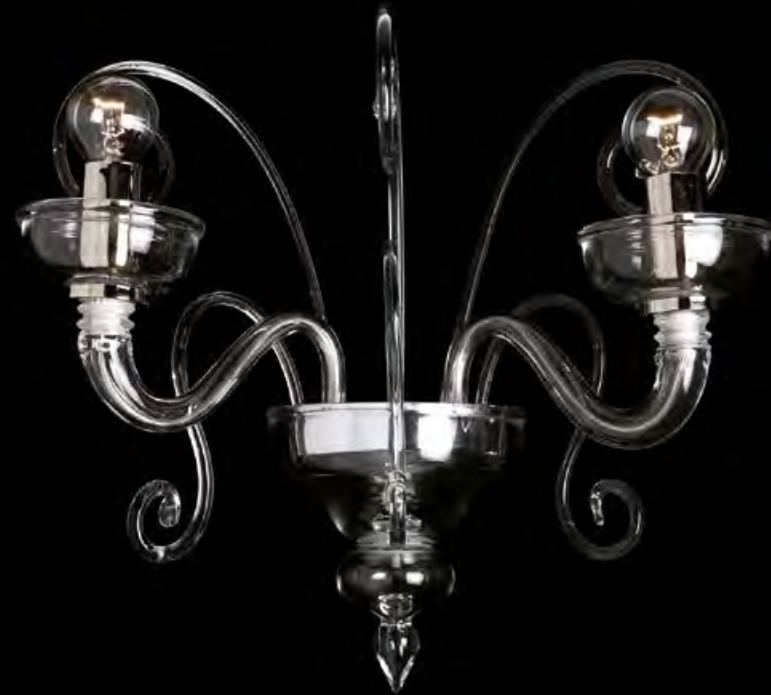
13/0214-A2 L40 P24 H35