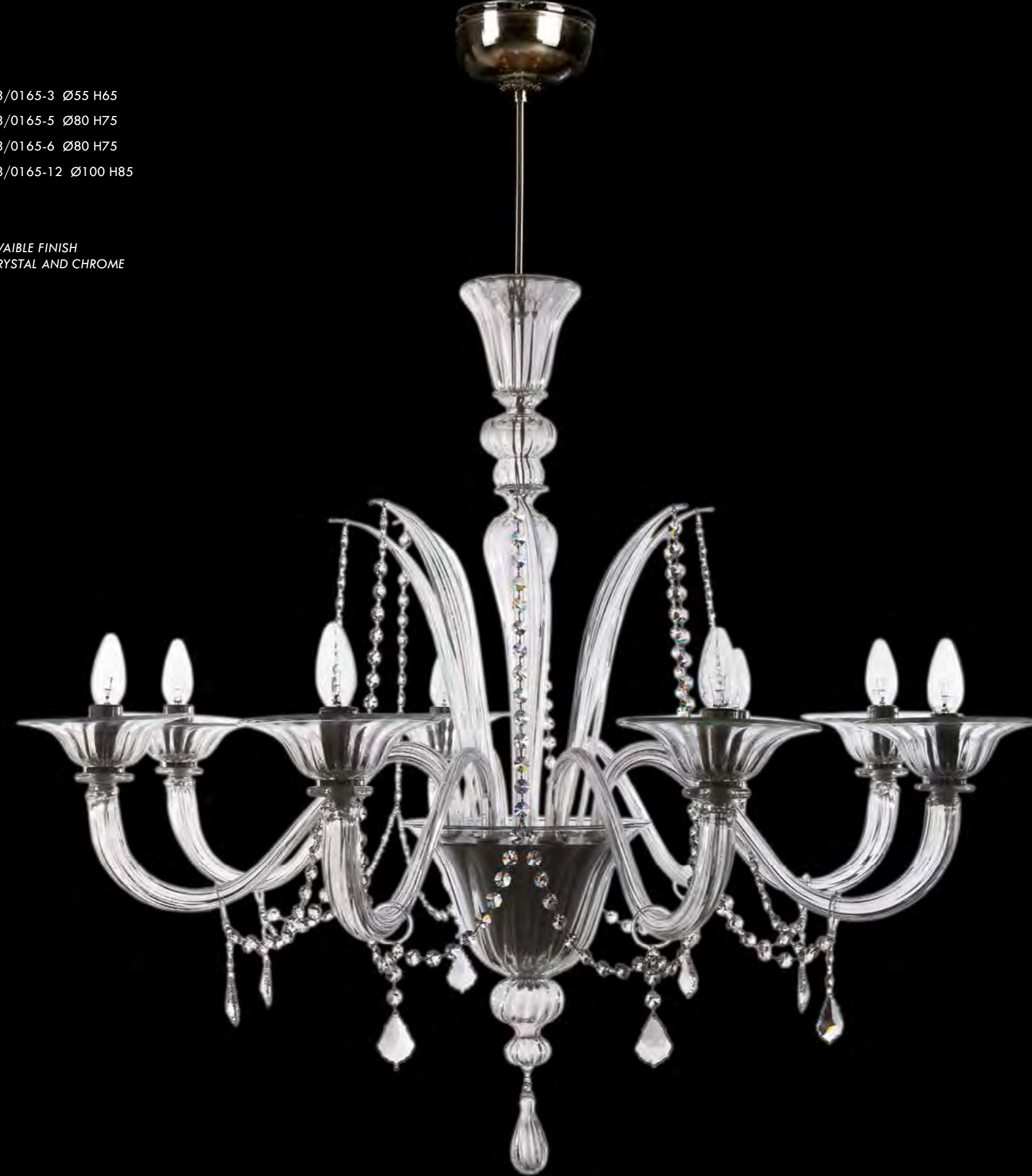
13/0165-8 Ø90 H85