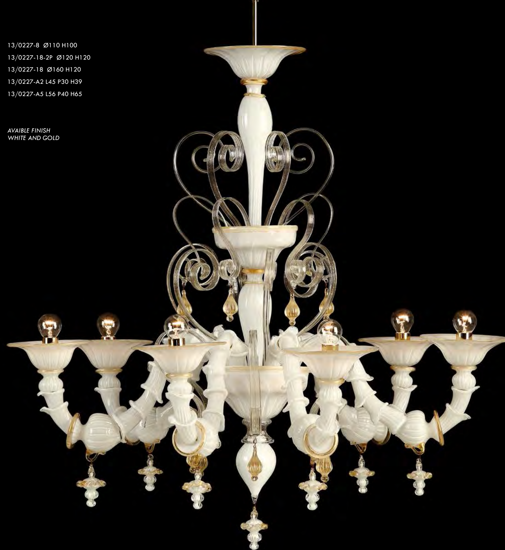
13/0227-6 Ø100 H95