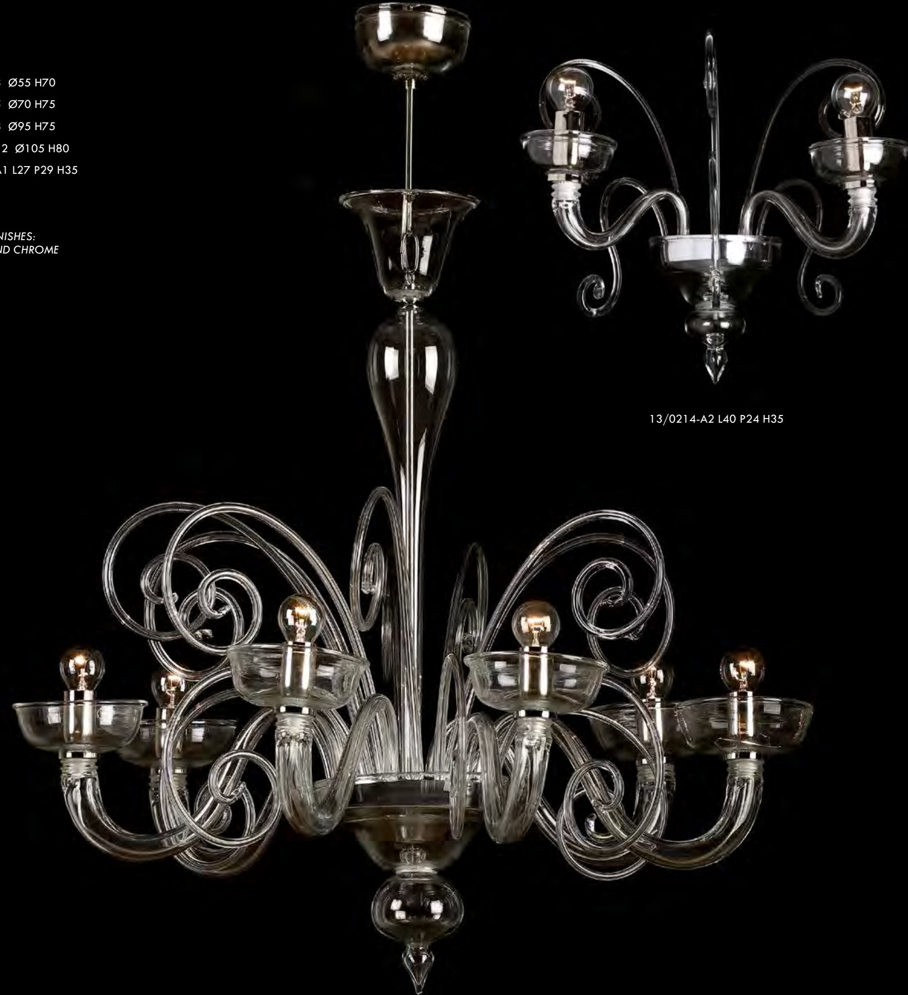
13/0214-6 Ø75 H75

AVAILABLE FINISHES: CRISTAL AND CHROME WHITE BLACK RED