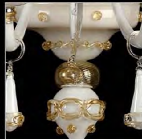
WHITE AND GOLD