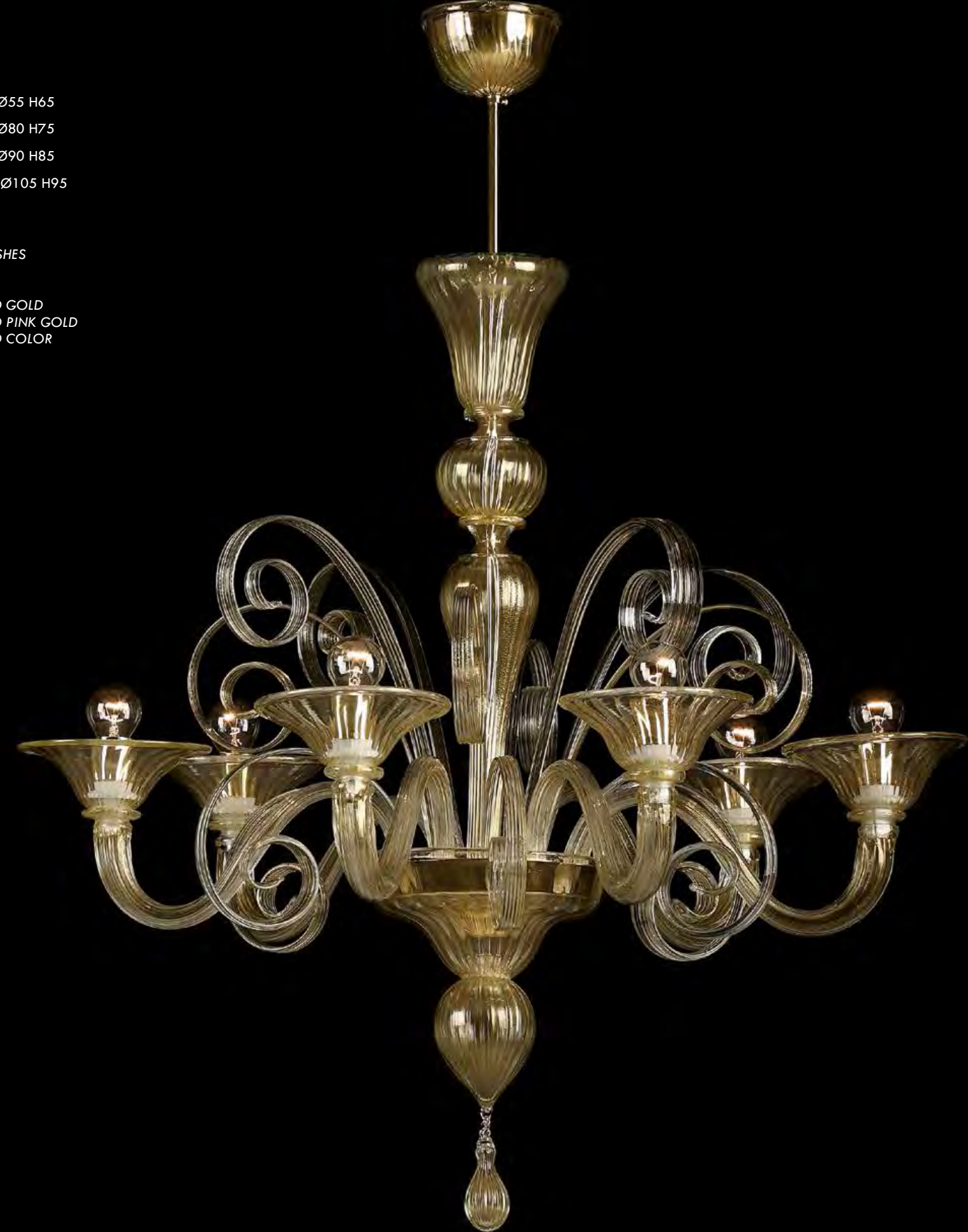
13/0217-6 Ø85 H75

AVAILABLE FINISHES CRYSTAL GOLD CRYSTAL AND GOLD CRYSTAL AND PINK GOLD CRYSTAL AND COLOR