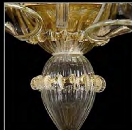
CRYSTAL AND GOLD