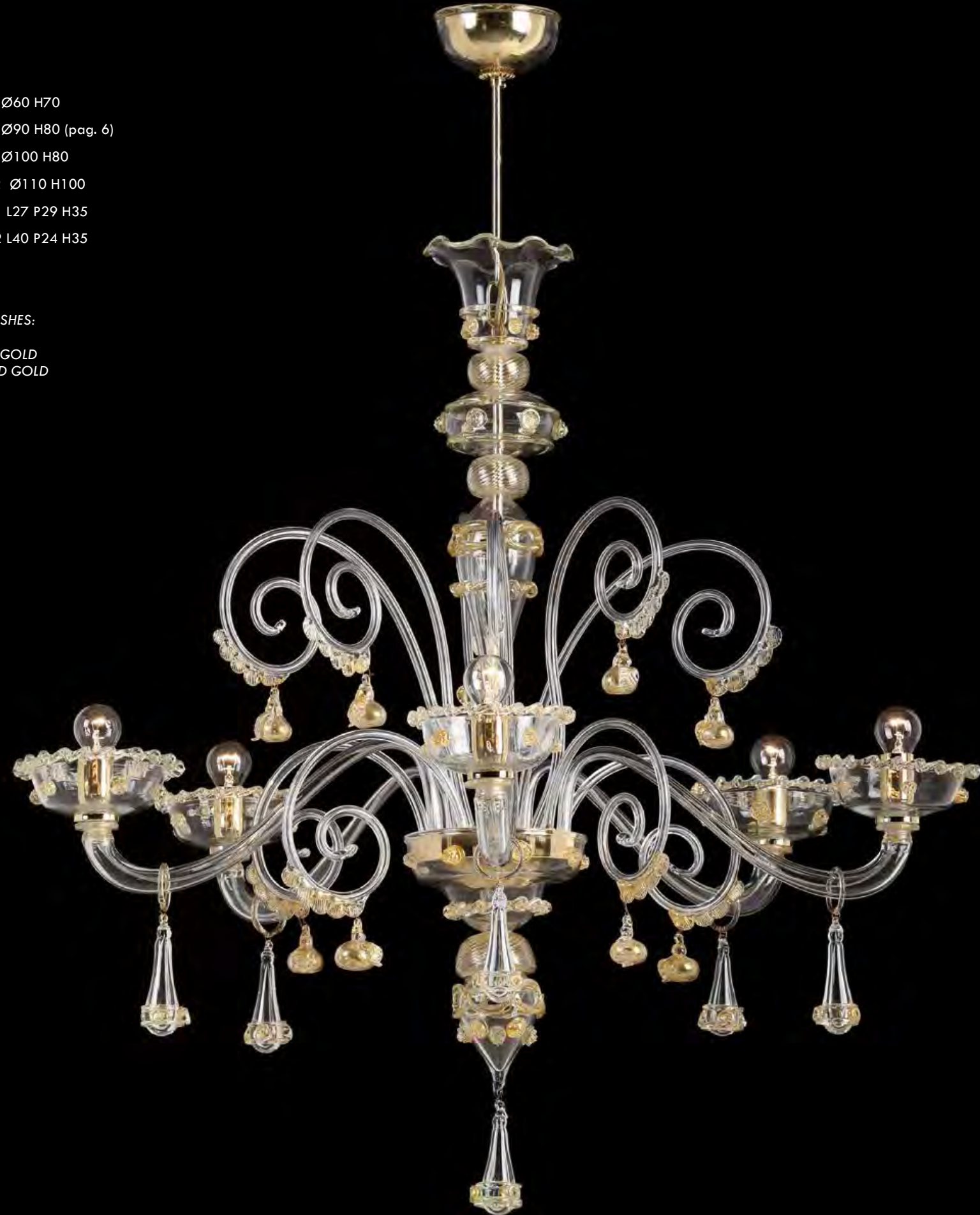
13/0225-5 Ø80 H80

AVAILABLE FINISHES: CRYSTAL WHITE AND GOLD CRYSTAL AND GOLD