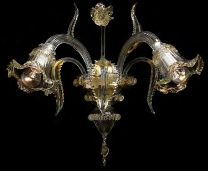
13/0219-A2 L35 P27 H35

AVAILABLE FINISHES CRYSTAL CRYSTAL AND GOLD CRYSTAL AND PINK GOLD CRYSTAL AND COLOR