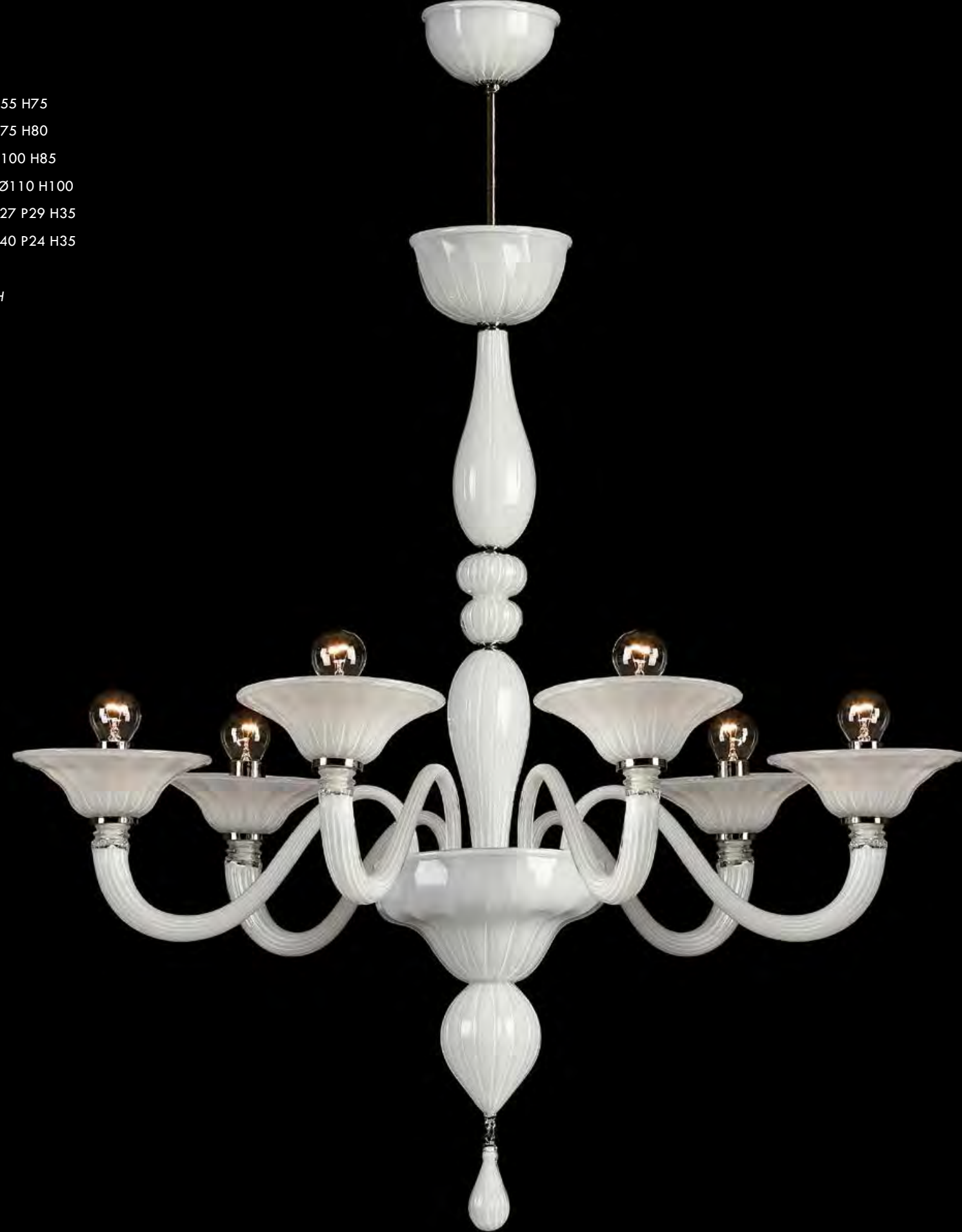
13/0222-6 Ø80 H80

13/0223-3 Ø55 H75 13/0223-5 Ø75 H80 13/0223-8 Ø100 H85 13/0223-12 Ø110 H100 13/0223-A1 L27 P29 H35