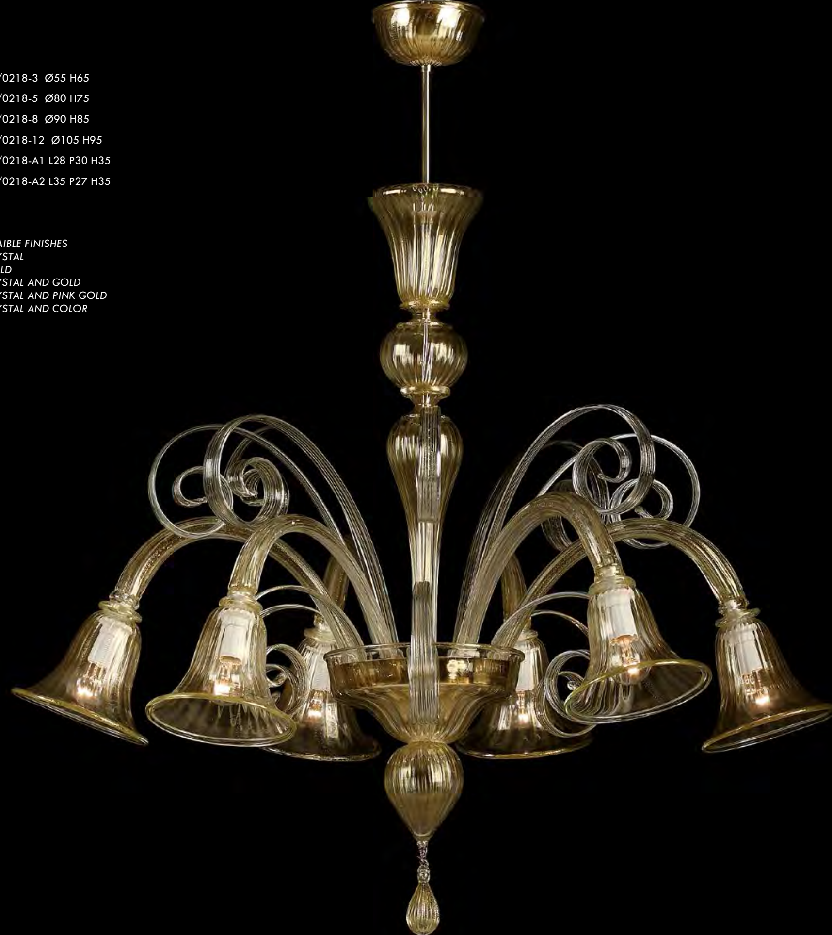
13/0218-6 Ø85 H75

AVAILABLE FINISHES CRYSTAL GOLD CRYSTAL AND GOLD CRYSTAL AND PINK GOLD CRYSTAL AND COLOR