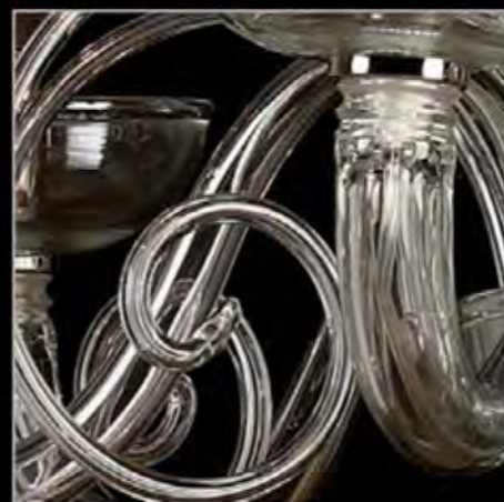
CRYSTAL AND CHROME