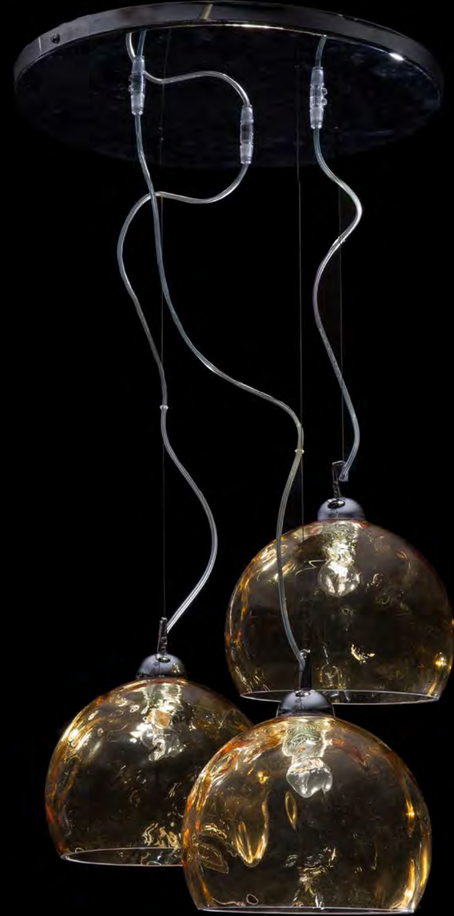
13/0236-3 L P H