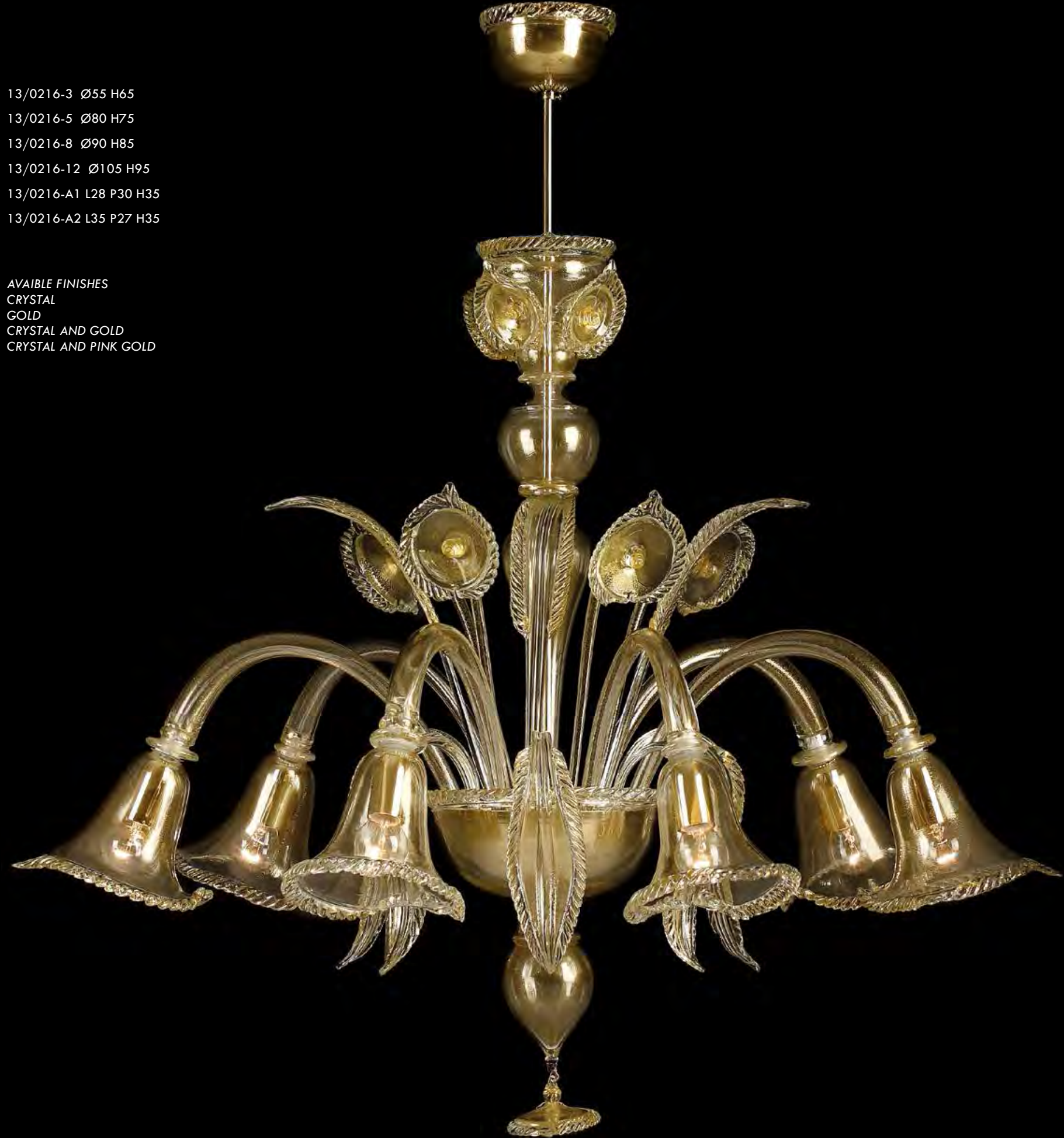
13/0216-6 Ø85 H75

AVAILABLE FINISHES CRYSTAL GOLD CRYSTAL AND GOLD CRYSTAL AND PINK GOLD