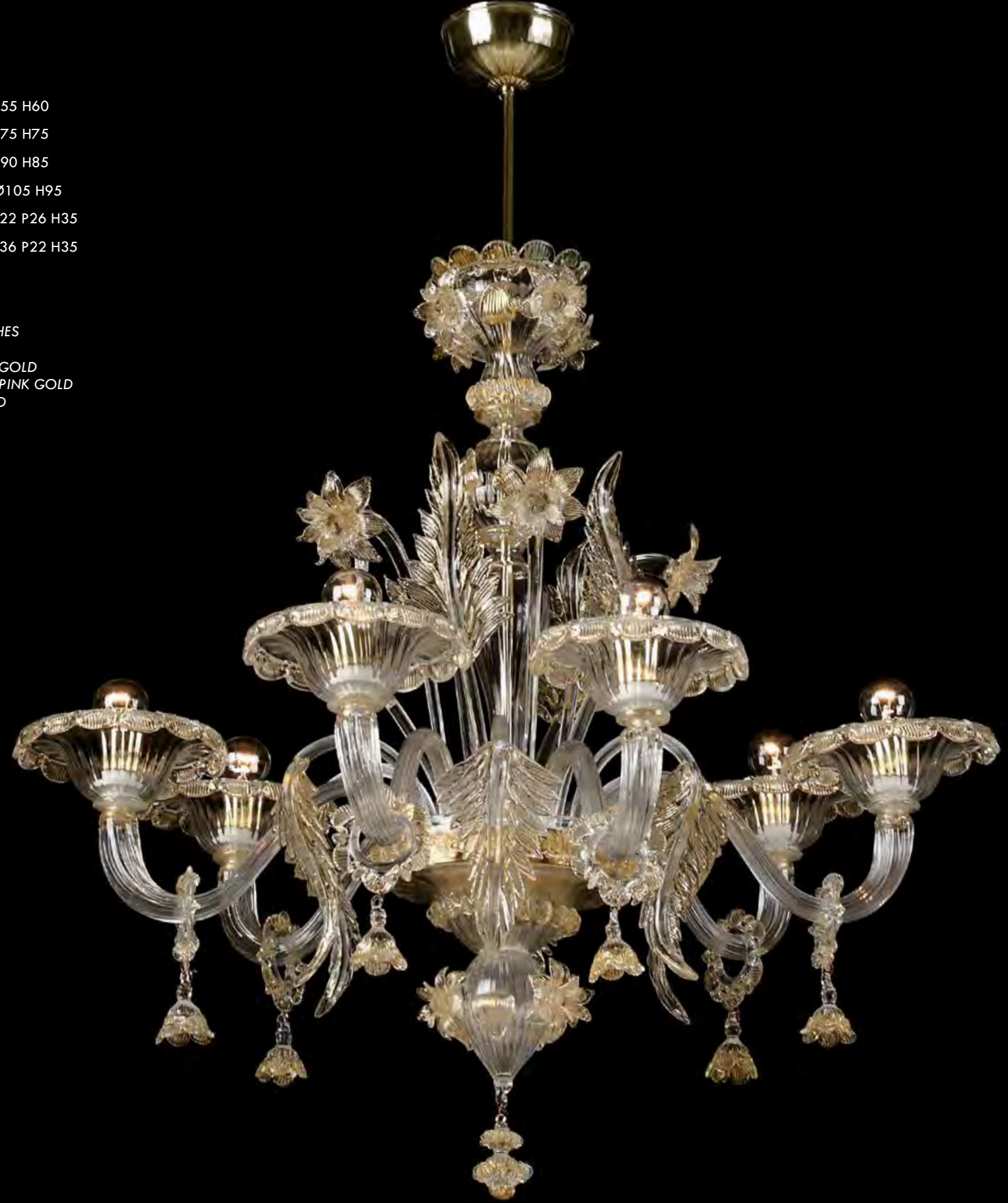
13/0230-6 Ø80 H75

AVAILABLE FINISHES CRYSTAL CRYSTAL AND GOLD CRYSTAL AND PINK GOLD RED AND GOLD