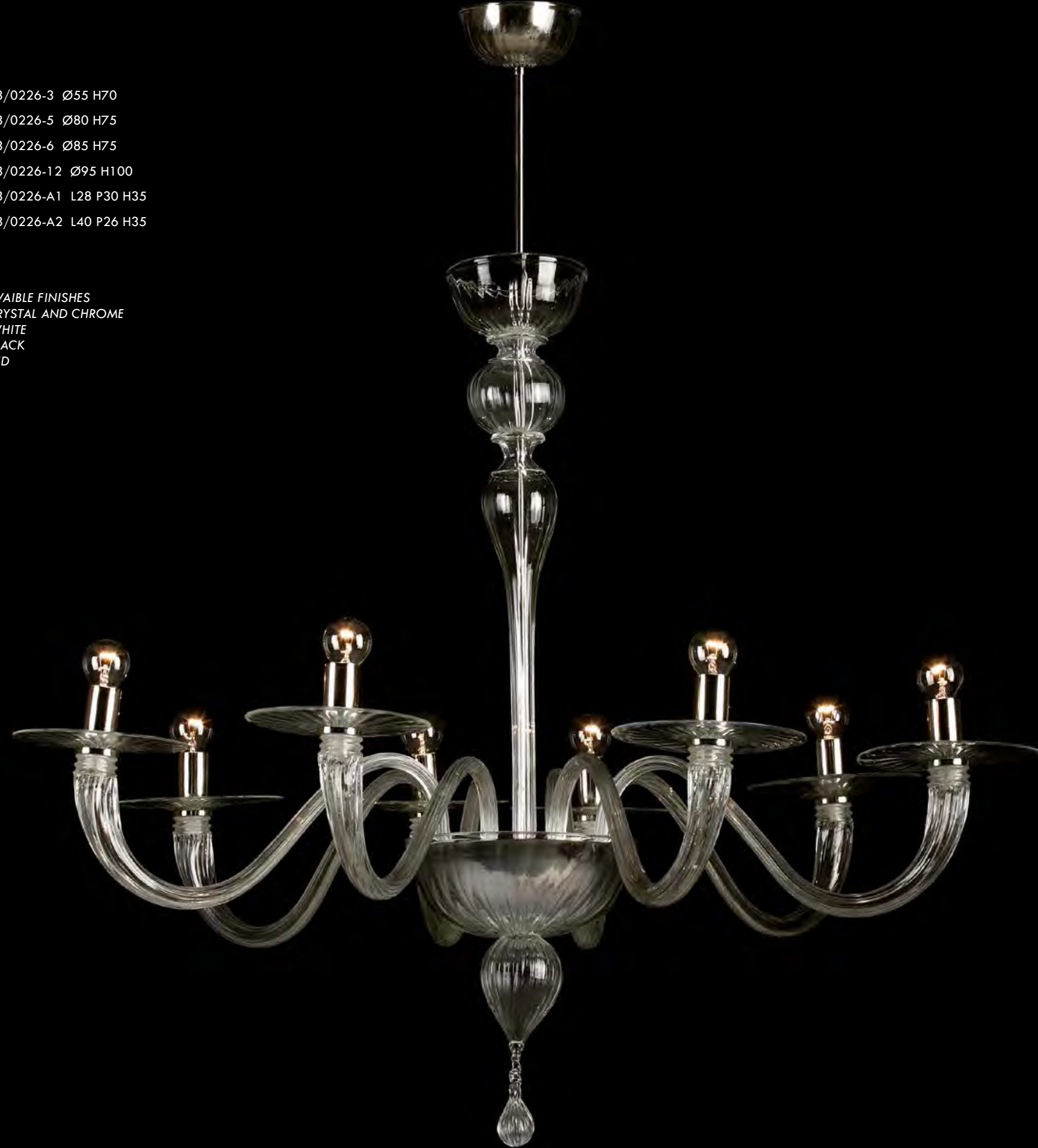
13/0226-8 Ø90 H85

AVAILABLE FINISHES CRYSTAL AND CHROME WHITE BLACK RED