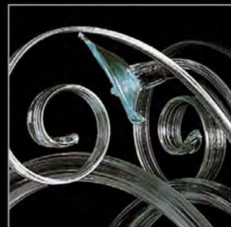
CRYSTAL AND COLOR (BLUE)