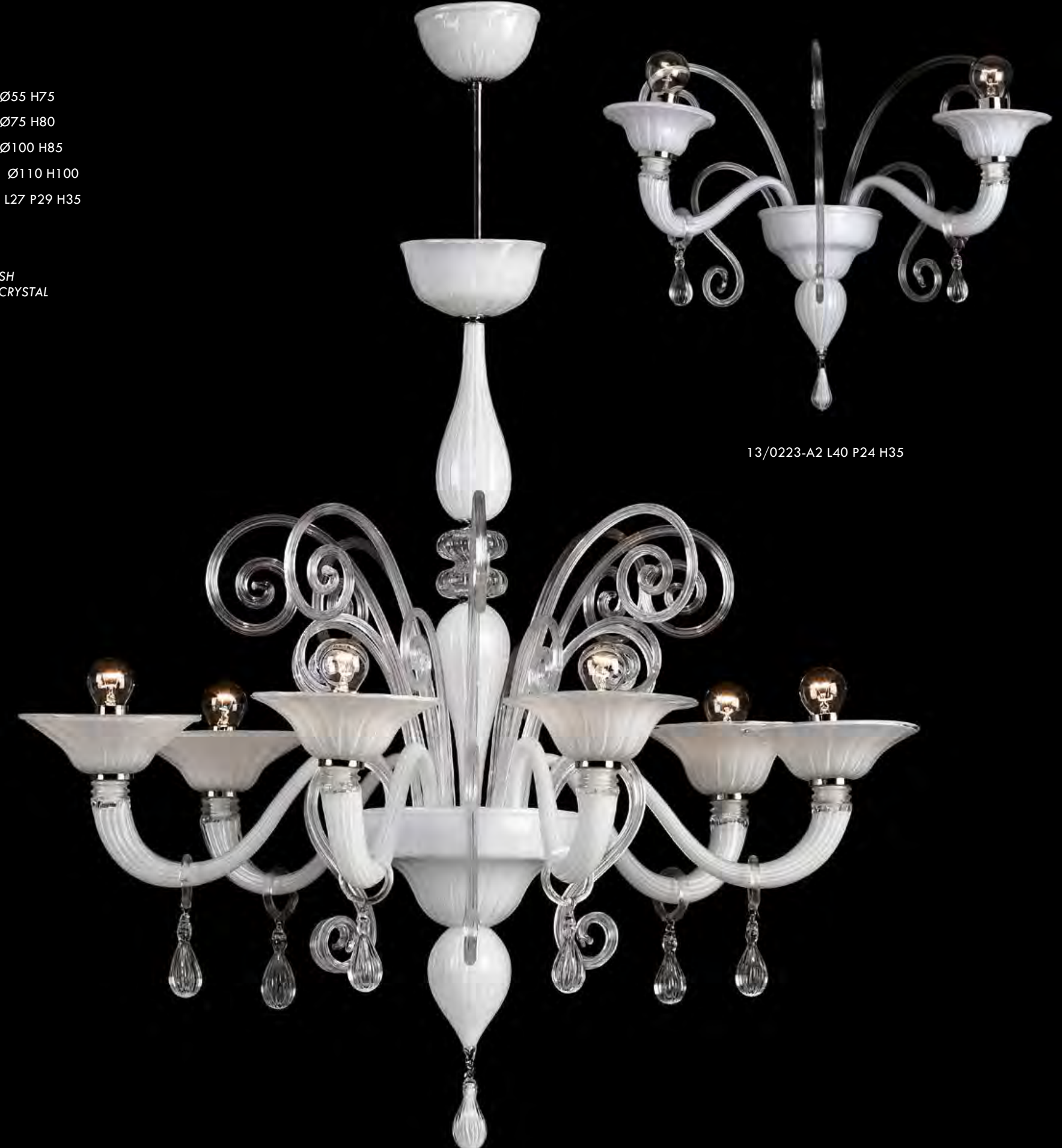
13/0223-A2 L40 P24 H35