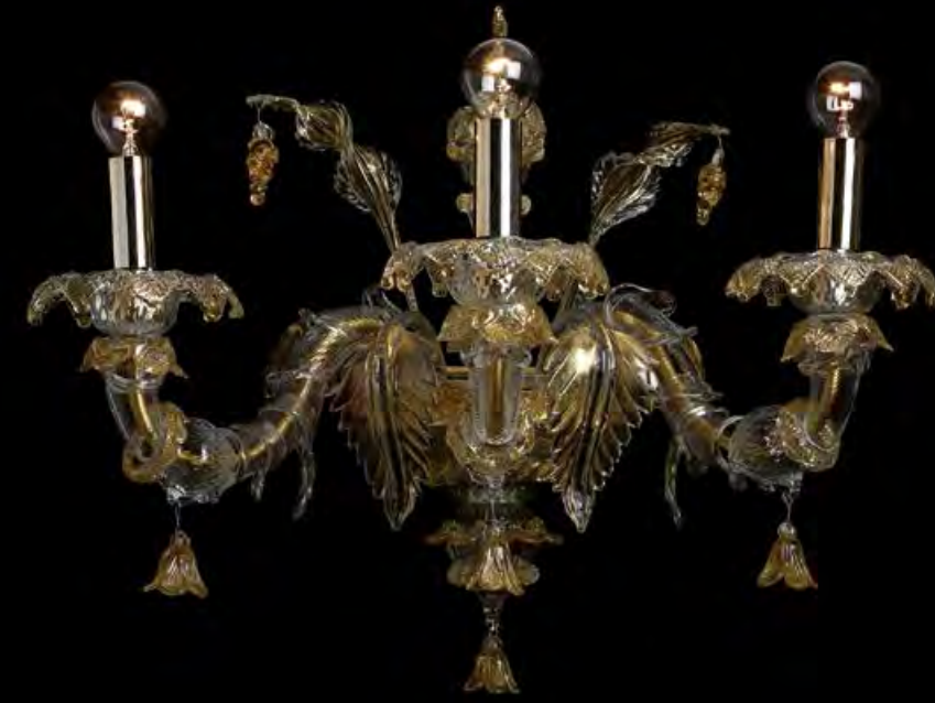
13/0233-A3 L45 P35 H45

AVAILABLE FINISHES CRYSTAL CRYSTAL AND GOLD CRYSTAL AND PINK GOLD