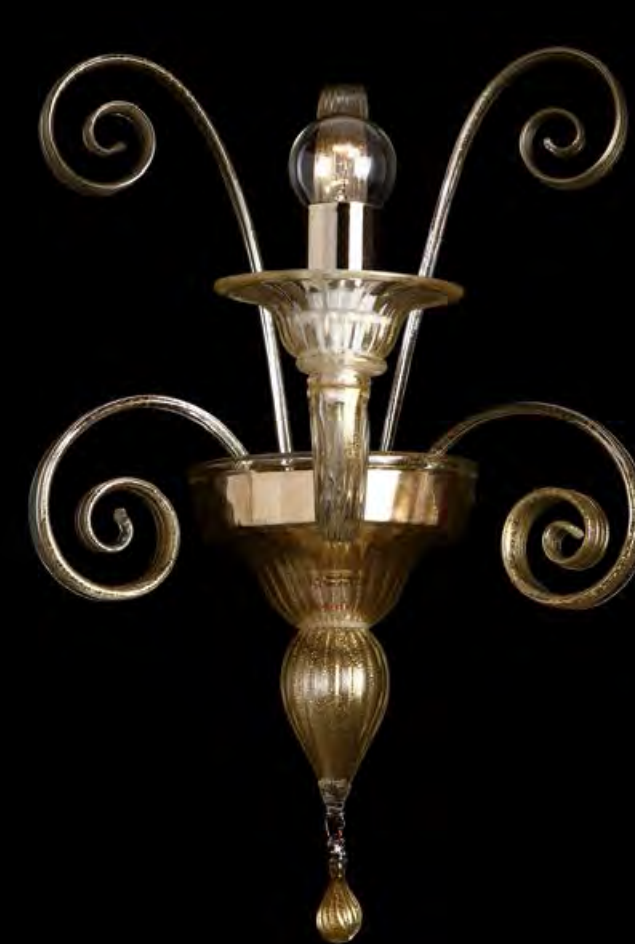
13/0217-A1 L28 P30 H35