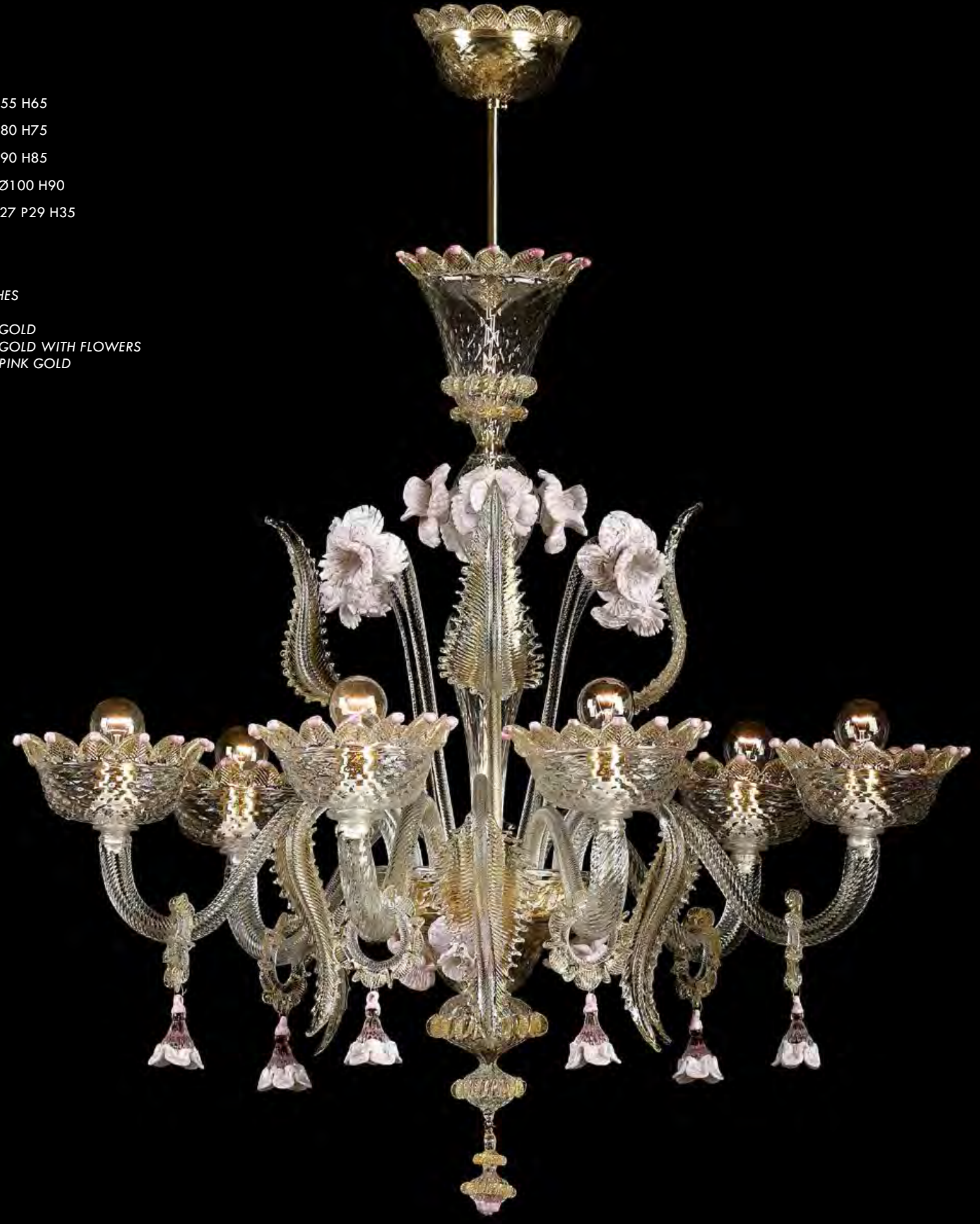
13/0231-6 Ø80 H75

AVAILABLE FINISHES CRYSTAL CRYSTAL AND GOLD CRYSTAL AND GOLD WITH FLOWERS CRYSTAL AND PINK GOLD