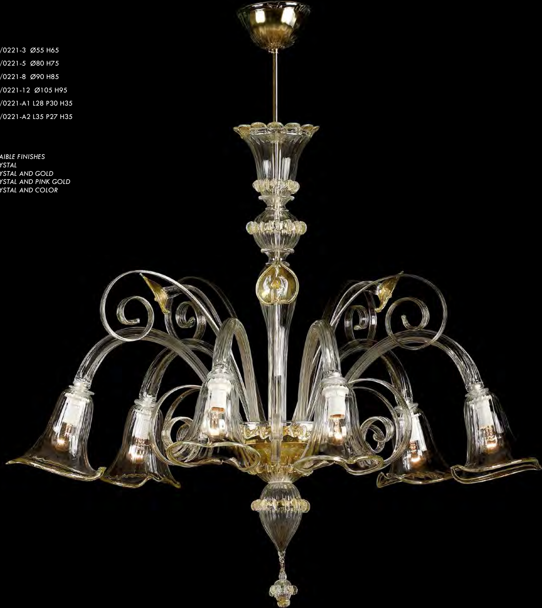
13/0221-6 Ø85 H75

AVAILABLE FINISHES CRYSTAL CRYSTAL AND GOLD CRYSTAL AND PINK GOLD CRYSTAL AND COLOR