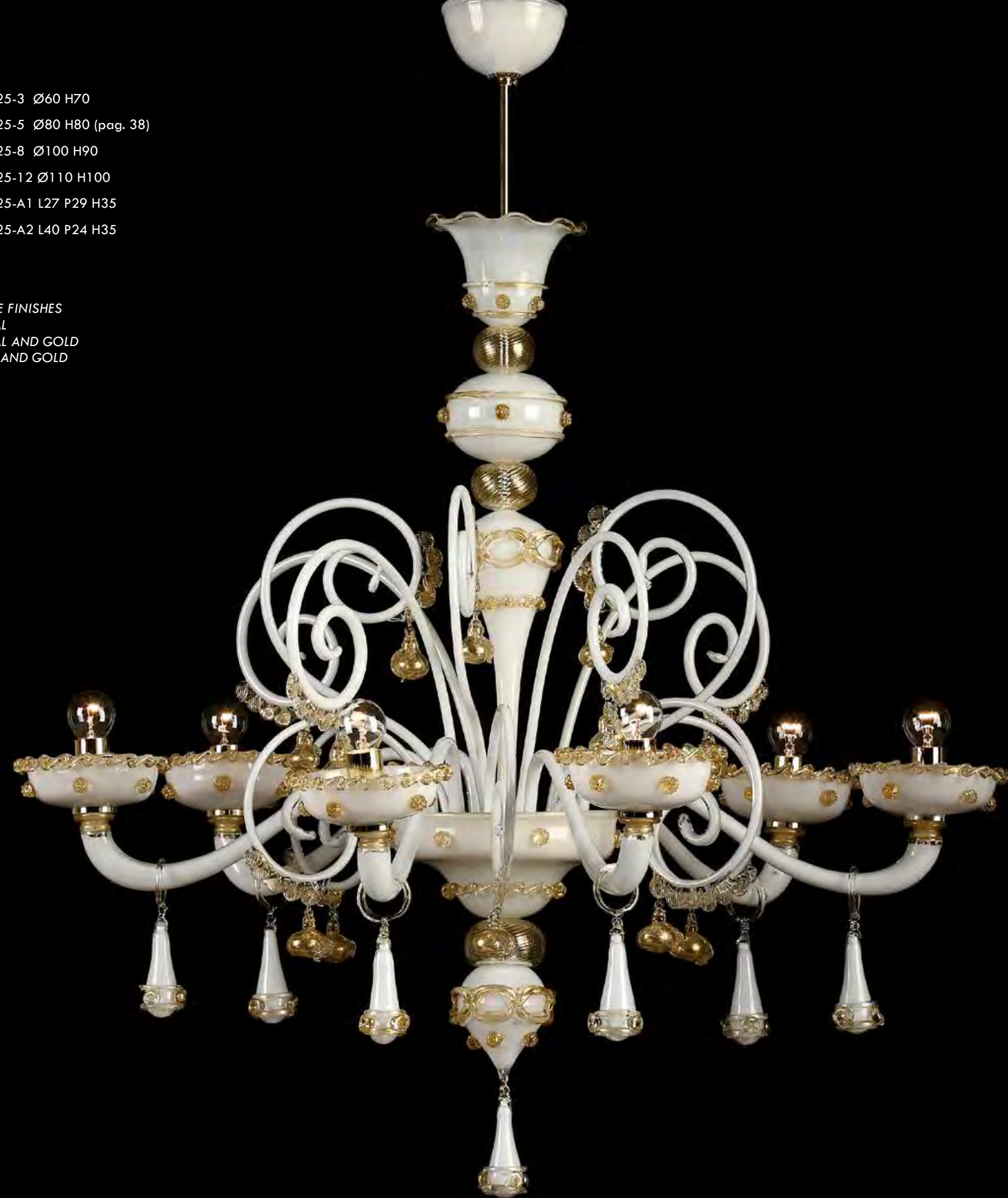
13/0225-6 Ø90 H80

AVAILABLE FINISHES CRYSTAL CRYSTAL AND GOLD WHITE AND GOLD