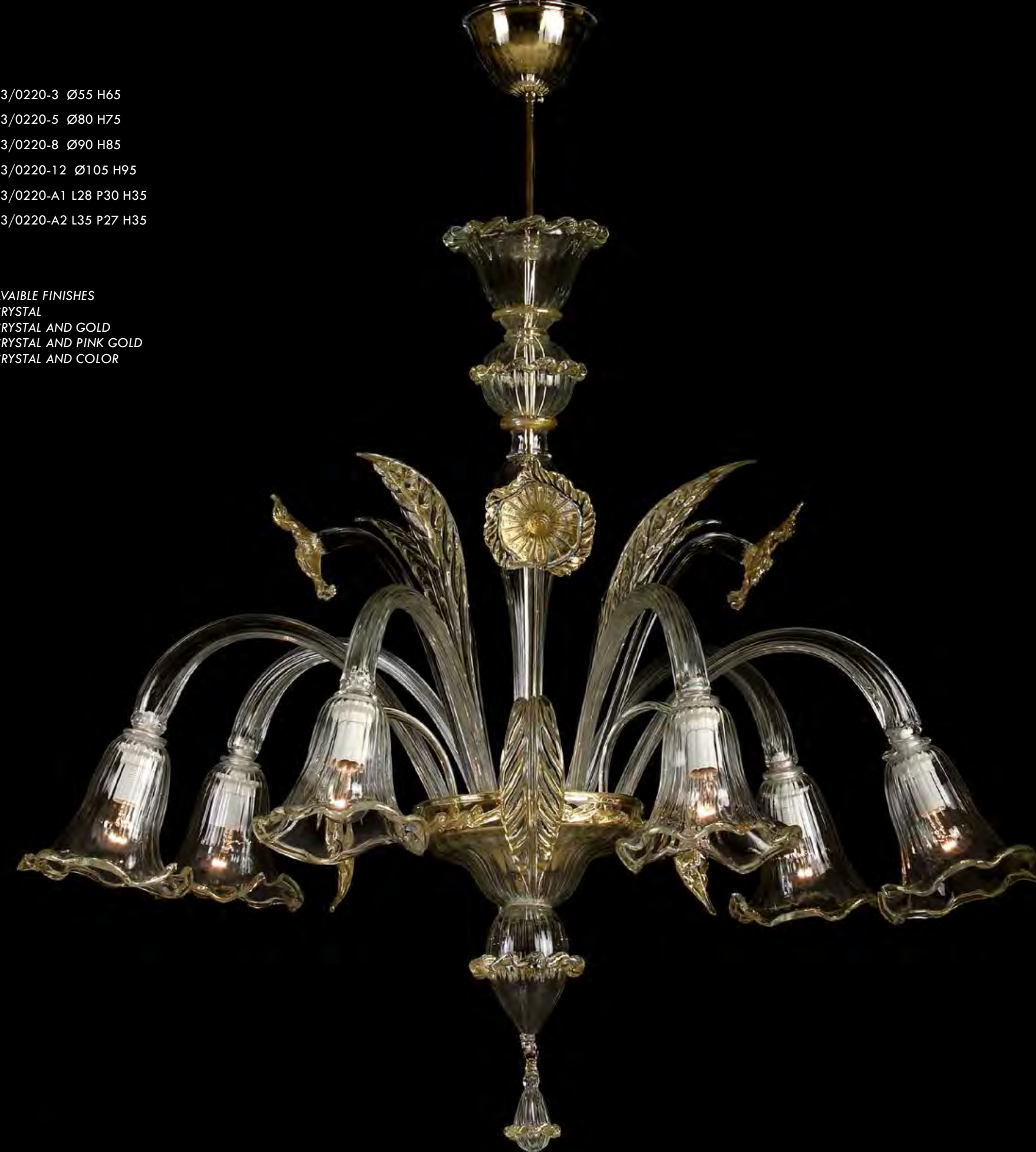
13/0220-6 Ø85 H75

AVAILABLE FINISHES CRYSTAL CRYSTAL AND GOLD CRYSTAL AND PINK GOLD CRYSTAL AND COLOR