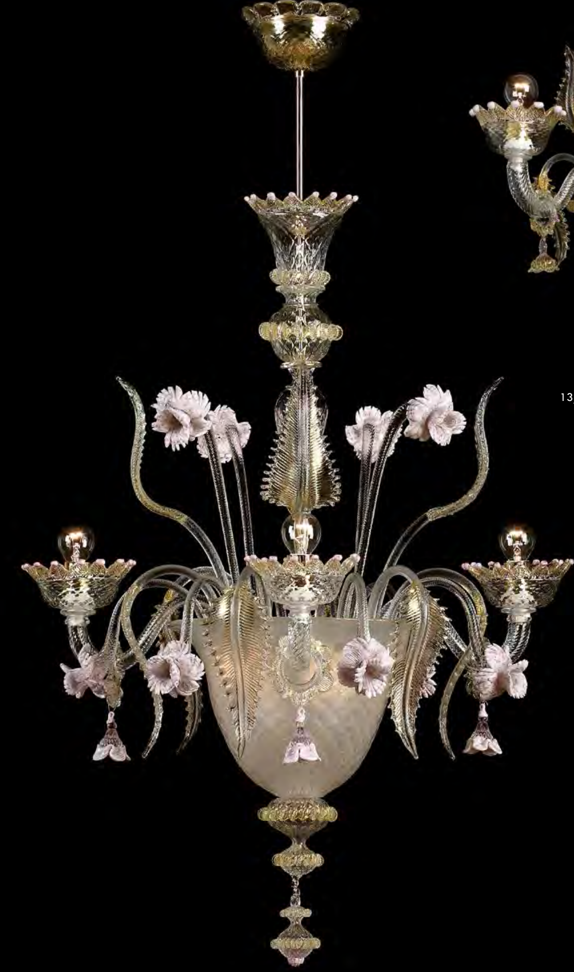
13/0231-PL Ø70 H80