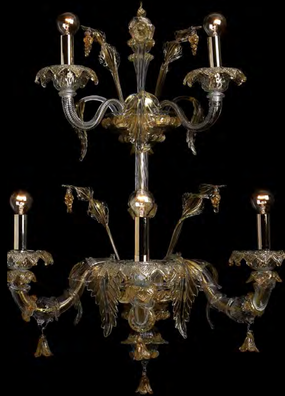
13/0233-A5 L45 P35 H78