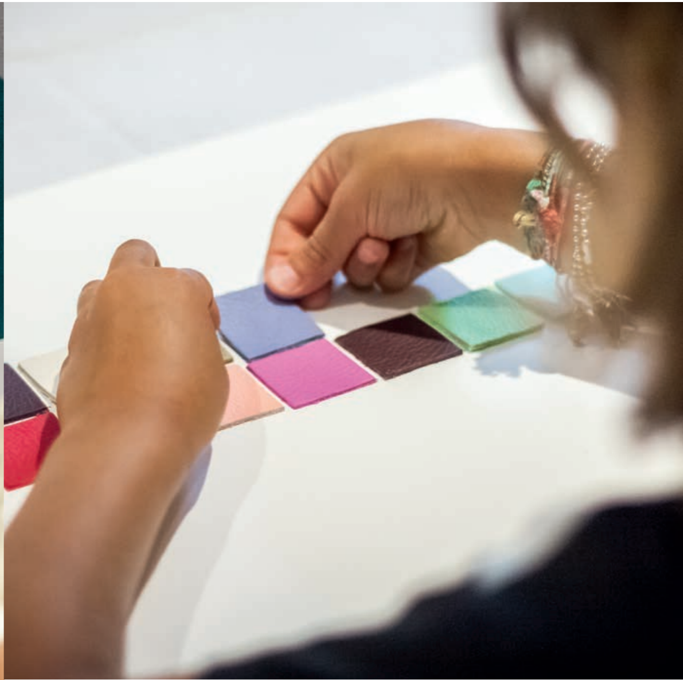
Vanity Fair Limited Edition. A kids game.