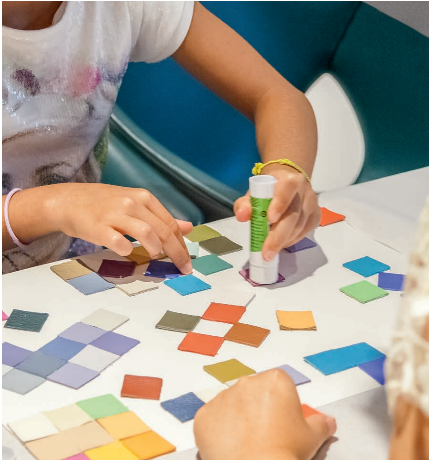
↑ ↗ Children's creativity at Poltrona Frau Museum. Coloured leather samples matching