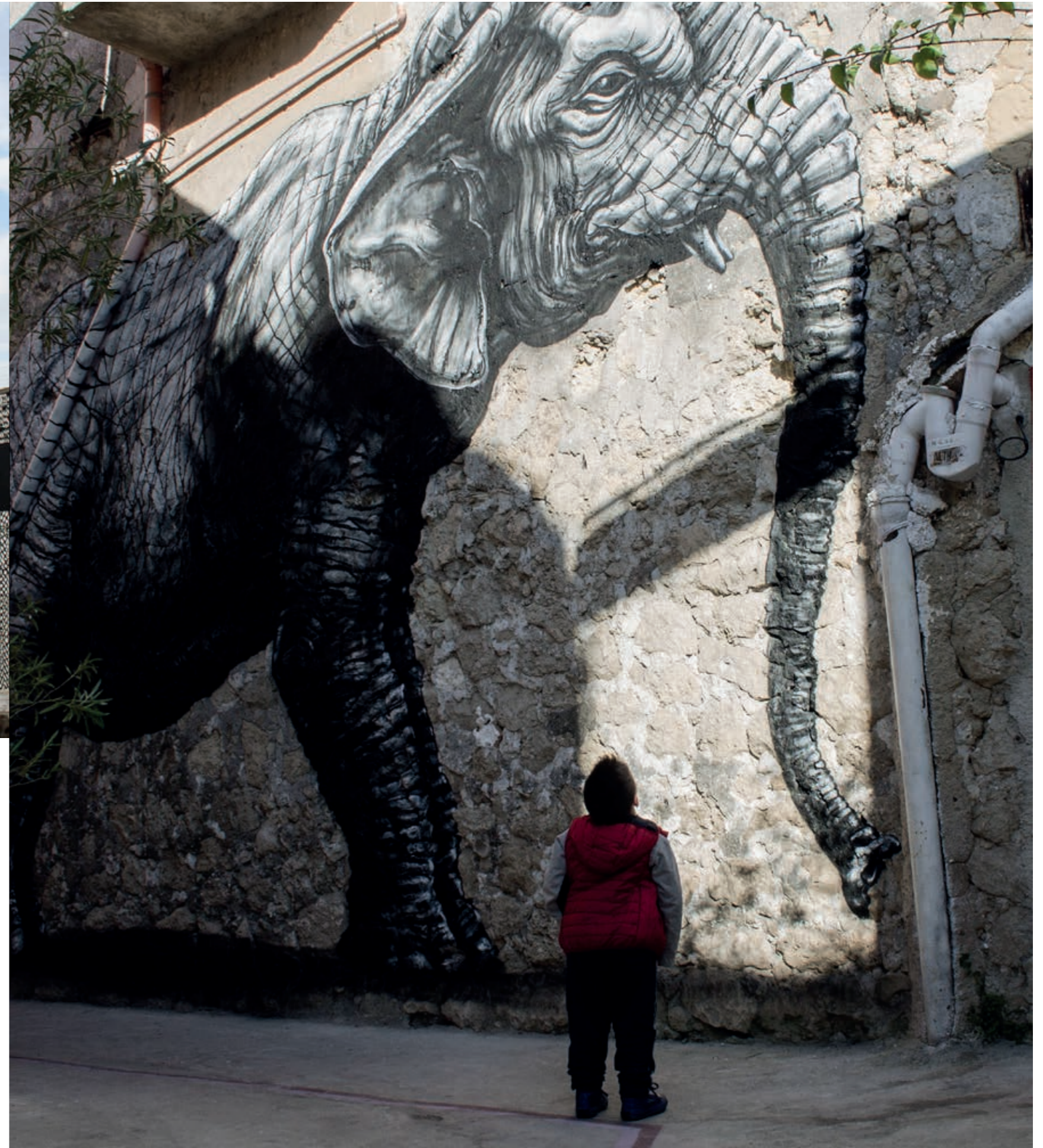
↑ Glimpse of Favara historical city centre ➤ Wall artwork made by David Diavù Vecchiato, known as ROA