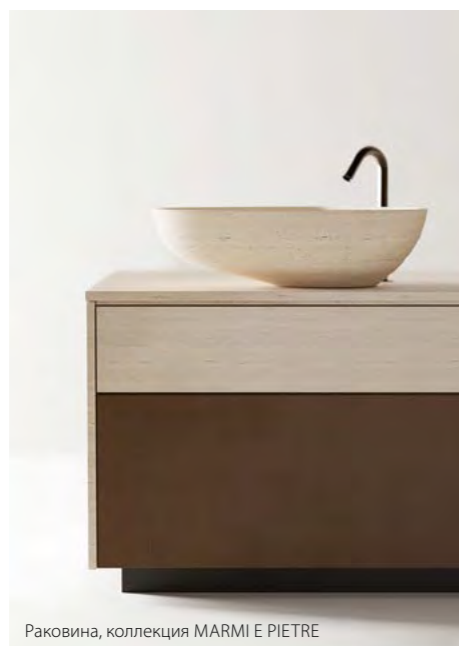
Раковина, коллекция MARMİ E PIETRE

Представительство фабрики в РФ: Archistudio +7 495 589-15-64 +7 920 278-28-51 (WhatsApp) archistudio@archistudio.su www.archistudio.su