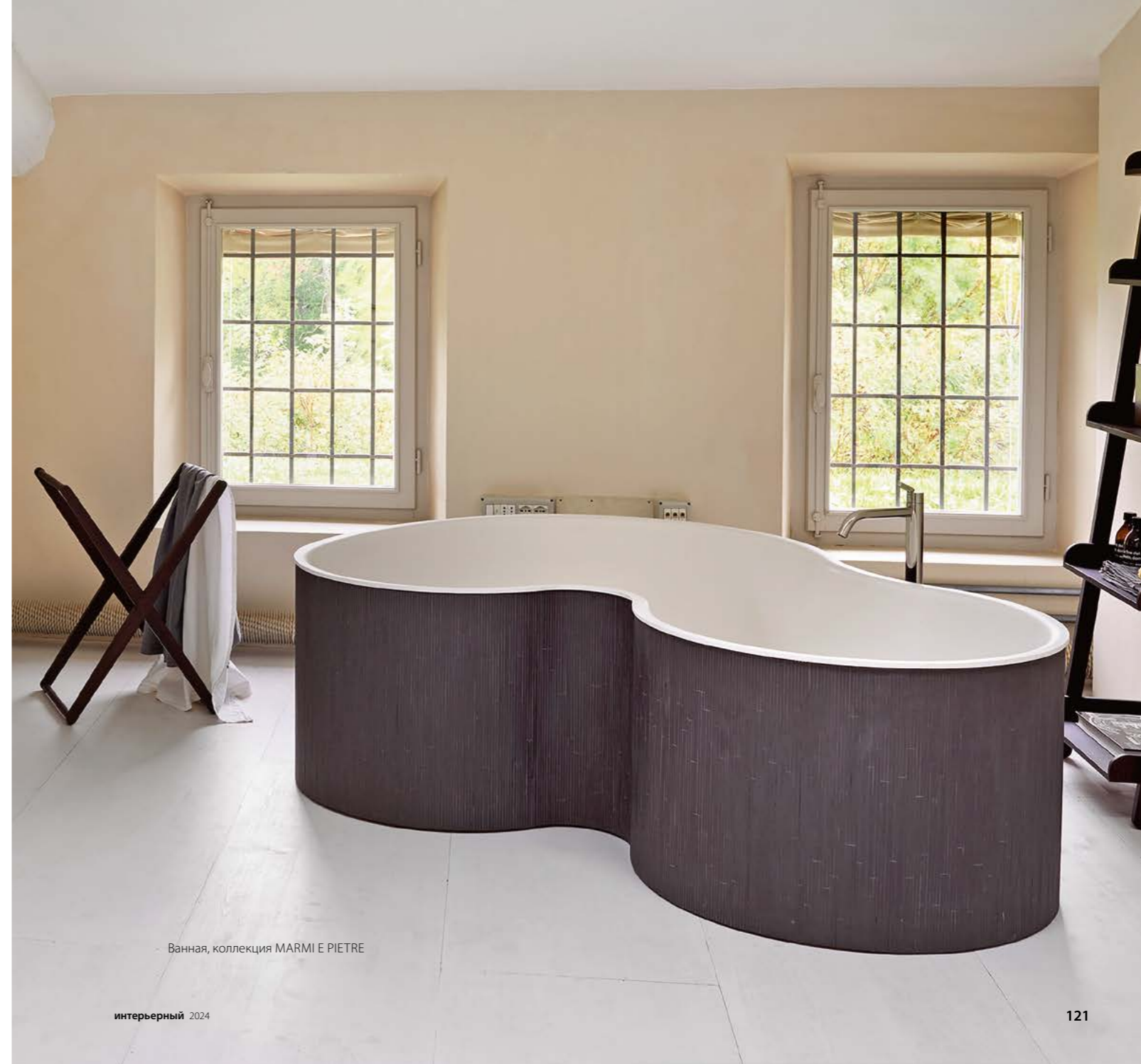
Ванная, коллекция MARMİ E PIETRE

В НОВОЙ КОЛЛЕКЦИИ MARMİ E PIETRE AGAPE ПЕРЕОСМЫСЛИВАЕТ СВОИ КУЛЬТОВЫЕ ПРОДУКТЫ, ИСПОЛЬЗУЯ БОГАТЫЙ ВЫБОР МРАМОРА, ТРАВЕРТИНА И ЛАВОВОГО КАМНЯ