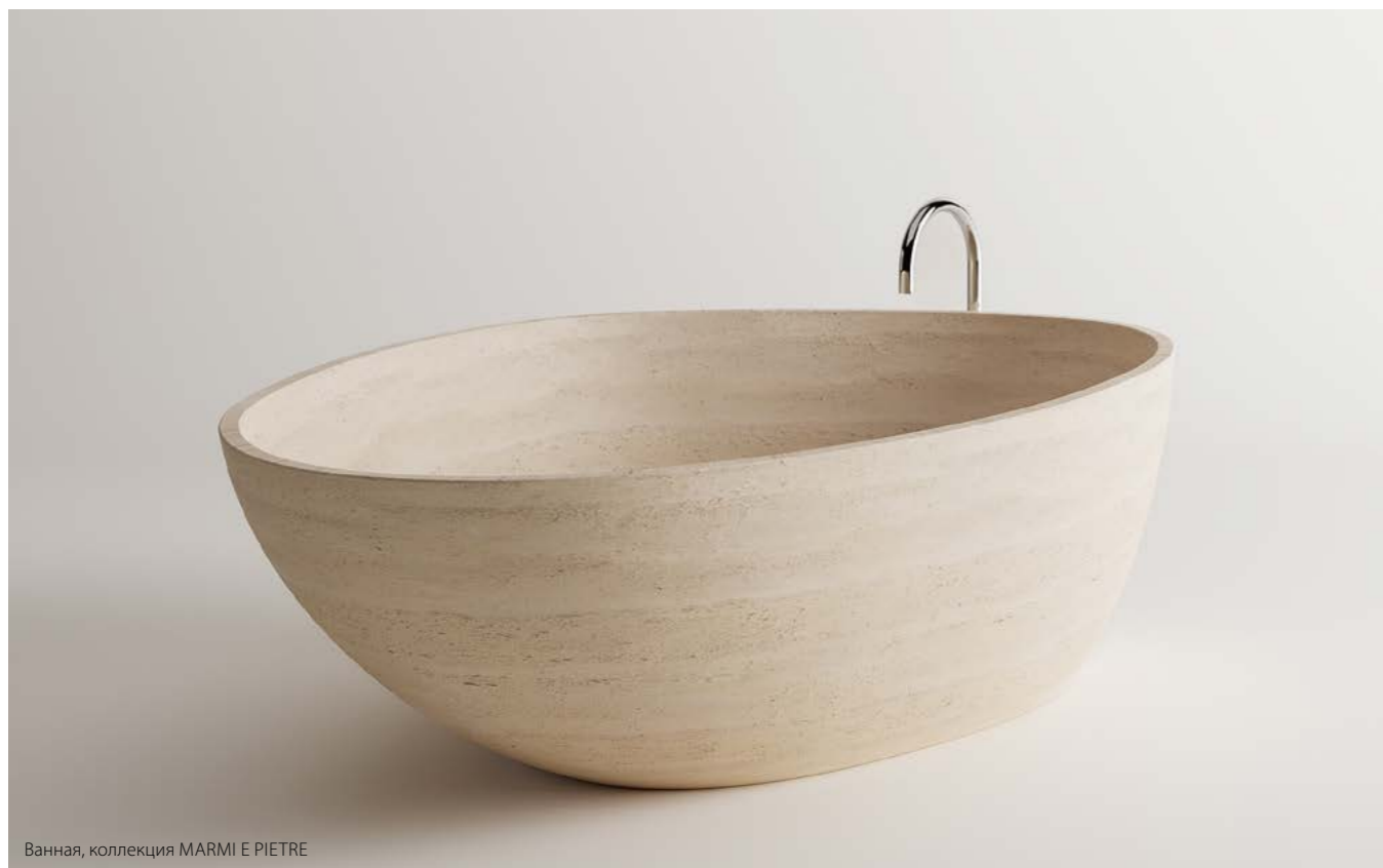
Ванная, коллекция MARMİ E PIETRE